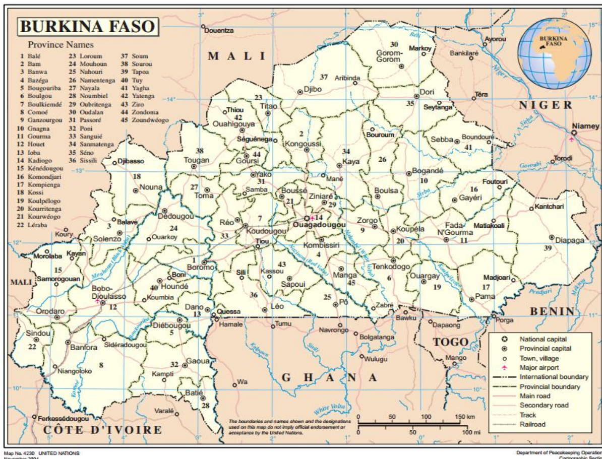
Map No. 4230 UNITED NATIONS November 2004

“ Terra dos homes honestos ” é o significado de Burkina Faso , nome adoptado oficialmente en xullo do 1984 por un país que ata entón denominábase Alto Volta, unha antiga colonia francesa que se independizou da metrópole o 5 de agosto do 1960.