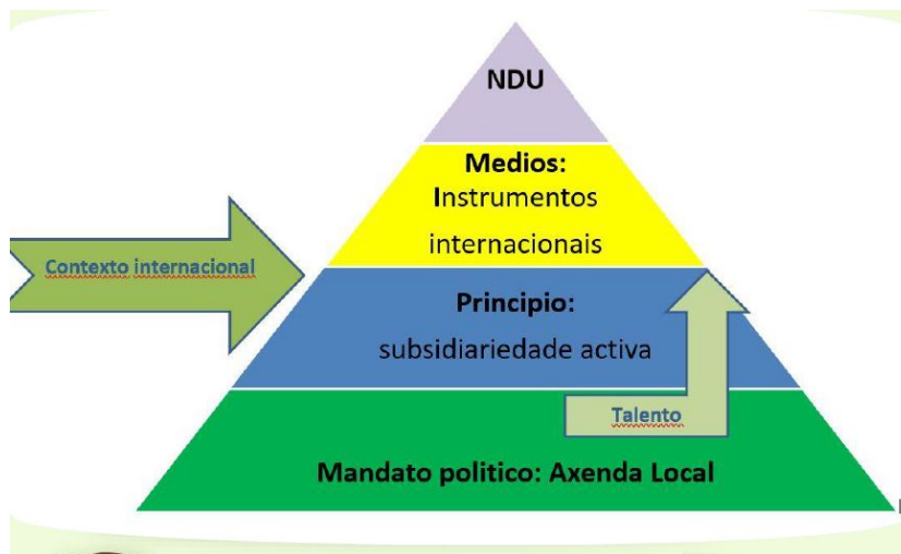
Diagrama da Nova Diplomacia Urbana (NDU)

Como se pode definir este proceso? A teoría da (nova) diplomacia urbana que tratei na miña tese pode servir de guía a este proceso: