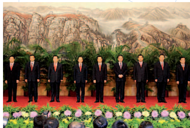
O CPBP saínte: Hu Jintao, Wu Bangguo, Wen Jiabao, Jia Qinglin, Li Changchun, Xi Jinping, Li Keqiang, He Guoqiang y Zhou Yongkang.

Un eixe que reclama unha especial atención é a problemática das nacionalidades minoritarias , nomeadamente en Xinjiang e no Tibet, onde se suman xa 60 inmolacións polo lume desde marzo de 2011. O inmovilismo nesta cuestión representa unha considerable ameaza para a estabilidade.